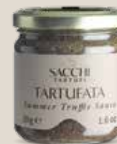
Tartufata 30 g - 1.6 oz