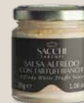
Salsa Alfredo 30 g - 1.6 oz