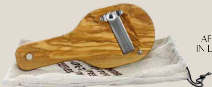
AFFETTATARTUFI IN LEGNO D'ULIVO AFLEG