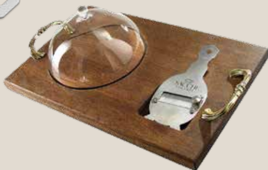
CAMPANA DI VETRO PORTA TARTUFO H100