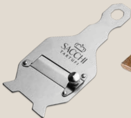
AFFETTATARTUFI IN ACCIAIO AFACC