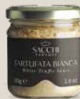
Tartufata Bianca 30 g - 1.6 oz

This exclusive selection includes three of our finest creations: White Truffle Sauce, Summer Truffle Sauce, and Alfredo White Truffle Sauce. "Trilogy" is the perfect gift for true gourmet lovers, an invitation to explore the world of Sacchi Tartufi: a kaleidoscope of refined and unforgettable flavors.